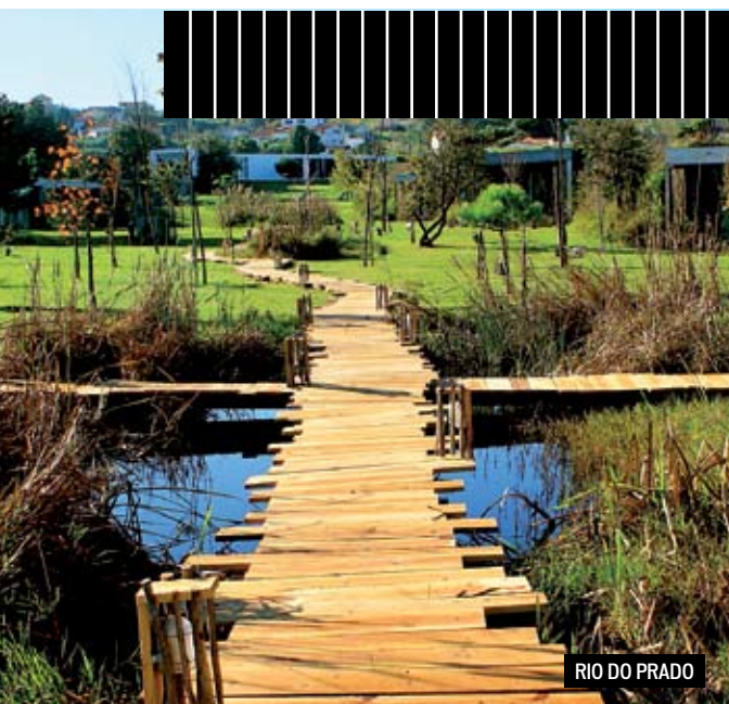
RIO DO PRADO