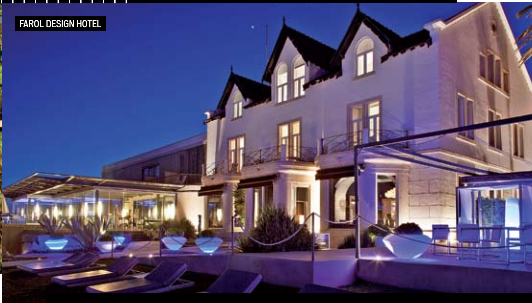
FAROL DESIGN HOTEL